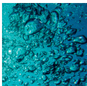
SÈVE BLEUE DES OCÉANS